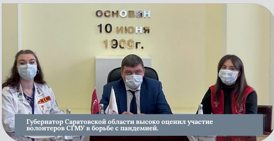
Губернатор Саратовской области высоко оценил участие волонтеров СГМУ в борьбе с пандемией.