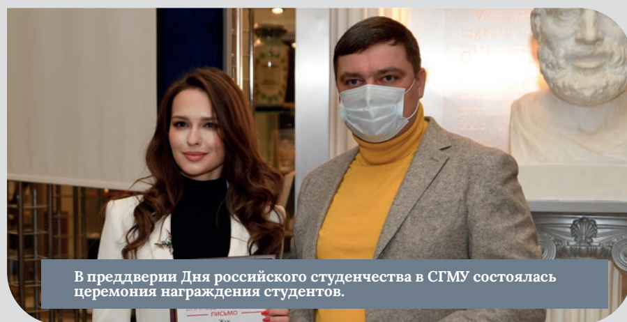
В преддверии Дня российского студенчества в СГМУ состоялась церемония награждения студентов.