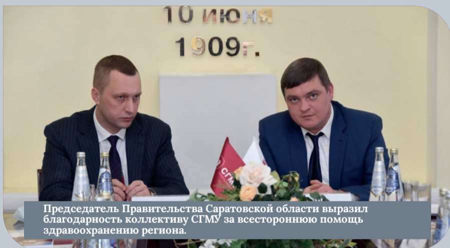
Председатель Правительства Саратовской области выразил благодарность коллективу СГМУ за всестороннюю помощь здравоохранению региона.