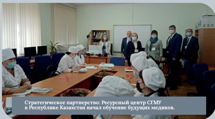
Стратегическое партнерство: Ресурсный центр СГМУ в Республике Казахстан начал обучение будущих медиков.