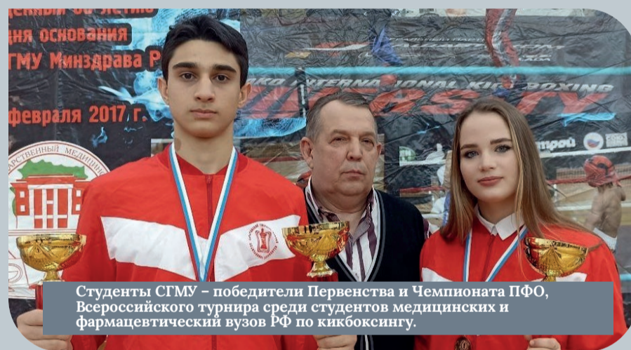
Студенты СГМУ – победители Первенства и Чемпионата ПФО, Всероссийского турнира среди студентов медицинских и фармацевтических вузов РФ по кикбоксингу.