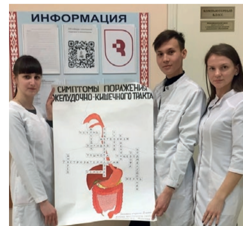
Кафедра госпитальной педиатрии и неонатологии

Как показала практика, использование кроссвордов успешно влияет на освоение дисциплины и специальности у студентов.