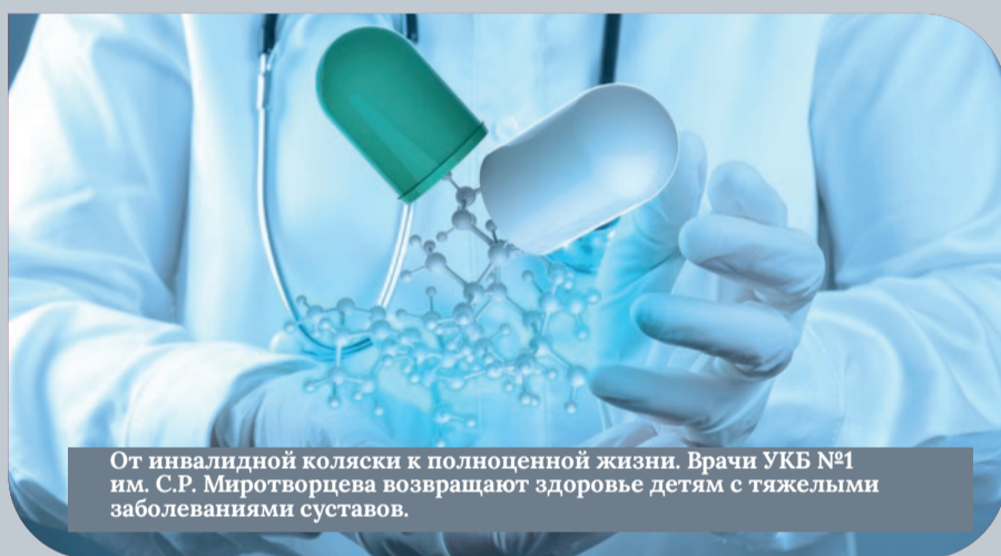
От инвалидной коляски к полноценной жизни. Врачи УКБ №1 им. С.Р. Миротворцева возвращают здоровье детям с тяжелыми заболеваниями суставов.